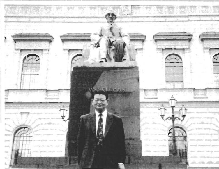
フィンランド中央銀行正面での筆者